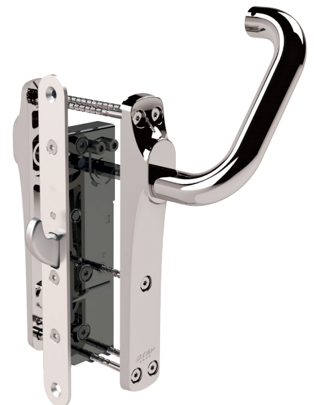
STEP 535 med STEP Exit ST17940-1

STEP 535 är utrustad med FreeDrive®. Den unika tekniken frikopplar motorn och växellådan, vilket innebär att de aldrig påverkas när utrymningsbehörets trycke används. Därmed minimeras påverkan på motor och växellåda – trots att beslaget kanske används tusentals gånger varje dag.